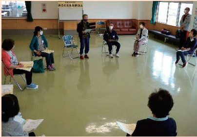
自己紹介と目標を語る受講生

みさと元気塾は、美里町から委託を受けて、社協が運営する介護予防教室です。本年度は4コース、それぞれ10回ずつの運動に加え、「口腔・栄養」「地域デビュー」「認知症サポーター養成講座」の座学も交えて6月に開講! 初回は、自己紹介や自分の“ありたい姿”“なりたい姿”を発表し、運動を始めるにあたって目標をつくりました。今後、学んだことはご自身だけでなく、ご近所や友人など地域の方々にも伝えていただき、健康の輪が広がることを願っています。