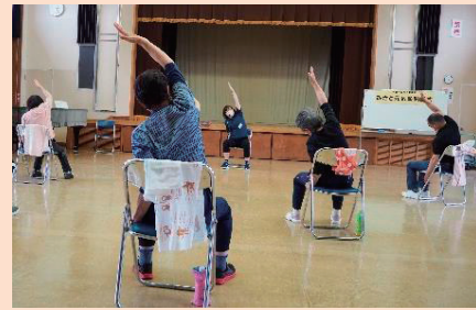
開講式後、さっそく運動!