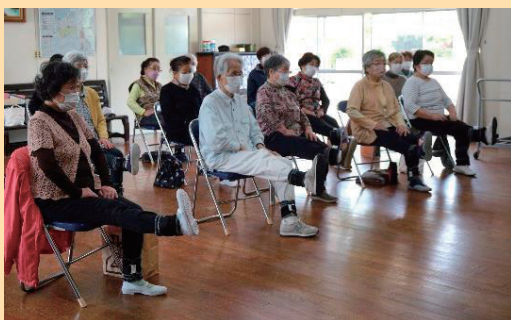
大口行政区の体操の様子

6月15日現在、町内の29行政区と2グループが定期的に活動中! 最近では、大口、不動堂6区の行政区がそれぞれ、週1回の体操を始めました。体力の維持・向上とともに、参加者同士のつながりもより一層深まっています。