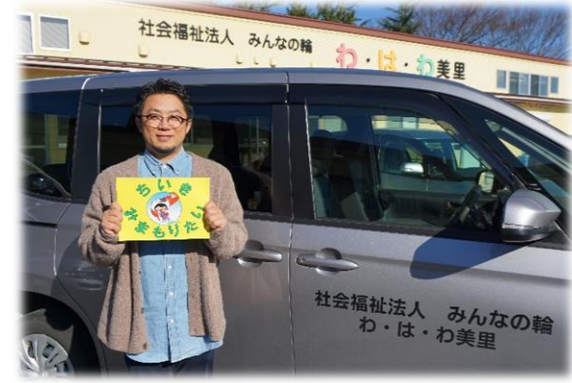
青生小学校近くの「わ・は・わ美里」さん

青生小学校が近いので、登下校中の子ども たちをいつも見守っています。 困ったことがあったら声をかけてくださいね。