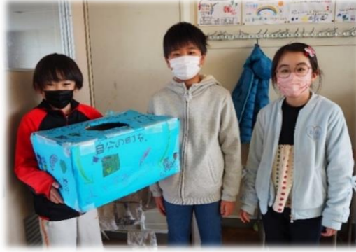
北浦小学校4年生 赤い羽根キッズ(校内募金活動)

今年も、それぞれの学校や職場、地域の中で、たくさんの募金活動が行われています。 よせられた募金は、「次の年の福祉活動」のために使われます！