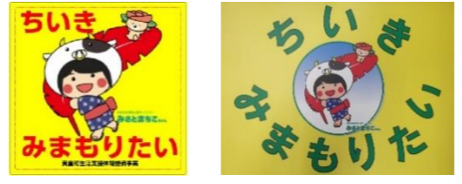
シール(左)とマグネットの2タイプあるよ♪

青生小学校が近いので、登下校中の子ども たちをいつも見守っています。 困ったことがあったら声をかけてくださいね。