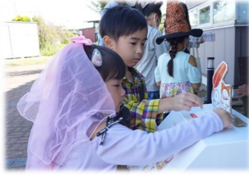
「みさとっこマーケット(10月)」 募金活動(水ヨーヨーコーナー)

赤い羽根共同募金は、「みんなが暮らしやすいまちをつくるために、みんなでお金を出し合っ て助け合う」募金です。たくさんの人たちが協力しあうことで、大きな助け合いのチカラになります。