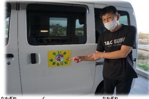
中埴小学校区の「ケアてらす中埴」さん

施設の車に「ちいきみまもりたいステッカー」 を貼り、地域を回るときは、見守っています。