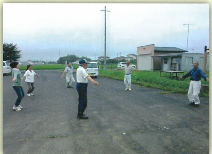
砂山ラジオ体操会のみなさん(下二郷2区 砂山)

「この集落ですっとみんなと暮ら していきたい。健康づくりの大切さ を広げていきたいんだ!」と参加者募 集中です。一人のきっかけを大事に し、人が集まる機会を地域でつくっ ていく事が住民同士のつながりを強 くしているようでした。