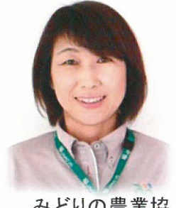
みどりの農業協 同組合 福祉部 福祉業務課長

JAの福祉事業がスタートし、早17年。今年度は「JAらしさ」そして地域共生社会の実現に向け「介護予防・生活支援サービス事業」に取り組んでいます。地域づくりの為、委員の皆様と美里の宝探しを行っていきます。