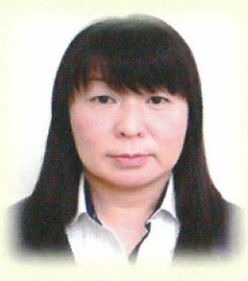
美里町社協 地域福祉課長

社協職員として福祉でまちづくりに取り組んでいます。これからも地区社協やボランティアなど住民の皆さんと共に小地域福祉活動を推進していきます。「ともに築こう 福祉のまちみさと」ふるさと美里町が大好きです♥