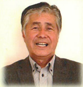
美里町 行政区長会 会長

区長として行政区の活動を行う傍ら、区長会の会長も務めております。地域づくりはゴールのないみちのりです。あせることなく、住民の誰もが、わかりやすく、親しみやすい地域の為になる協議会にしていきたいです。