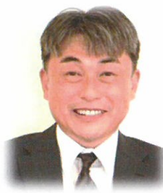
美里町 健康福祉課長

いつまでも住み慣れた地域で安心して暮らし続けることができるよう、支え合いの地域づくりを目指しています。元気な地域づくりの為、様々な事例や仕組みを提案していけるよう、協議会委員として皆さんと共に話し合いを進めていきます。