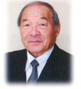
(公社)美里町 シルバー人材セ ンター事務局長

核家族化の進行によって、一人暮らしや高齢者家族が増加している現状の下で、シルバー人材センター事業活動を通して得た知識や情報等を生かしながら、協議体委員として活動をして行きたいと思っています。