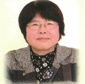
不動堂地区民生 委員・児童委員 協議会 会長

これまでの民生・児童委員の経験から地域の急激な変化を強く感じています。住民ひとりひとりが誰かの為に、ほんの少し行動することが将来の希望につながります。誰もが笑顔で暮らせる地域を共につくってきたいです。