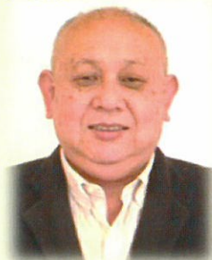
(有)まりちゃん家 取締役事務長

少子高齢化が進む中、今後の地域づくりは行政に頼るだけでなく、住民も考え方を転換し「自分達の地域は、自分たちで。」という考えをもつ必要があると考えます。安心して暮らせる地域の為に、できる事に一生懸命取り組んでいきます。