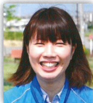
皆さんのところへ おじゃまします。

生活支援コーディネーターは地域の支え合い推進委員とも呼ばれます。「地域の気になる人」と「気に掛けている人」をつなぐ専門職です。地域の中にあるさりげない活動(宝物)を把握し、その情報をたくさんの人に分かりやすく伝えていく役割を担っています。