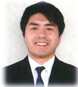
遠田商工会 主査 経営指導員

普段は、地域の会員企業の経営課題解決の為の支援、地域の為のイベント等をしています。今までの経験を活かし、地域の支え合い活動推進の為、地域内会員企業への情報提供をしていきたいと思えます。