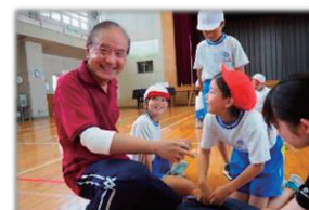
▲福祉教育推進「まなびねっと」