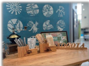
▲野菜やジャムなどの販売、レクリエーションコーナー

誰もが安心して暮らし続けられる地域づくりに向けて、今後も皆様と手を取り合い、進んでまいります。