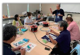
▲ボランティア・地域活動講座

昨年度の募金(4,837,497円)の内、美里町には3,081,327円が令和5年度の地域福祉事業費として配分され、ボランティア活動や福祉教育の推進事業などに役立てられています。