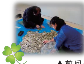
▲前回の活動の様子▲

「こころのよせあい運動」に、皆さまからお寄せいただいた『プルタブ』『使用済み切手』の仕分けを行います。プルタブは町内の小学校に入学する児童へ贈る防犯ブザー購入費として、使用済み切手は発展途上国での救援活動等に活用されます。気軽にボランティア体験してみませんか？